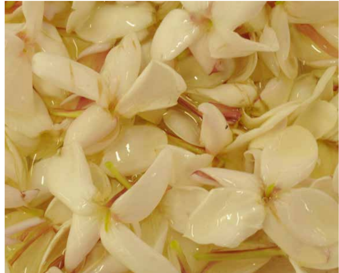
Macération de jasmin à froid

L'étude des parfums antiques fait appel à plusieurs disciplines scientifiques. Pour commencer, l'archéologie qui, grâce aux fouilles et aux analyses, permet de formuler des hypothèses sur les processus de fabrication, sur les matières premières et sur l'utilisation des parfums. La philologie ensuite qui, depuis plusieurs siècles, scrute les sources écrites antiques afin d'établir des textes débarrassés des scories occasionnées par la transmission des manuscrits et interprétés à la lumière de la critique interne et externe des œuvres. La botanique, qui, grâce aux travaux des archéobotanistes, permet d'identifier les végétaux utilisés dans la fabrication des parfums. La description botanique des matières premières végétales dans les textes, même accompagnés de quelques dessins ou gravures est en effet souvent imprécise et confuse. De plus, certains de ces végétaux sont de nos jours difficiles d'accès, parfois même en voie de disparition. Il devient alors nécessaire de les remettre en culture. La chimie enfin, qui par des analyses adaptées, peut retrouver certains composants des parfums antiques piégés dans les parois des flacons et qui par l'expérimentation, est à même de reformuler certains d'entre eux. L'étude des procédés de fabrication, de la composition chimique des parfums et de leurs caractéristiques olfactives, est donc réalisée par des chimistes et des parfumeurs.