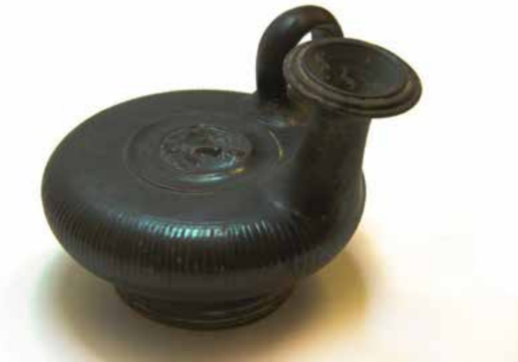
Guttus lenticulaire, 325-300 av J.C., Apulie Céramique Collection Musée International de la Parfumerie