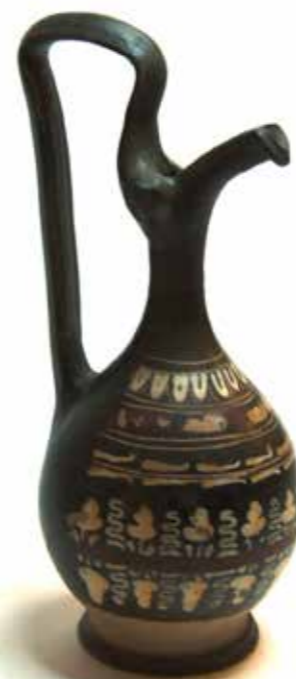
Epichisis, 400-300 av J.C., Apulie

Durant toute l'Antiquité, la principale base utilisée pour fixer les odeurs était l'huile végétale. En Mésopotamie et en Égypte, ce sont les huiles de ben, de sésame, de radis noir et d'amande qui étaient les plus employées. En Grèce classique, Théophraste cite l'huile de ben, d'amande amère, de sésame, d'olives vertes et d'olives sauvages.