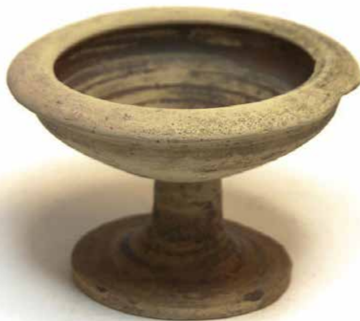
Coupelle, 600-500 av. J.C., Etrurie Terre cuite