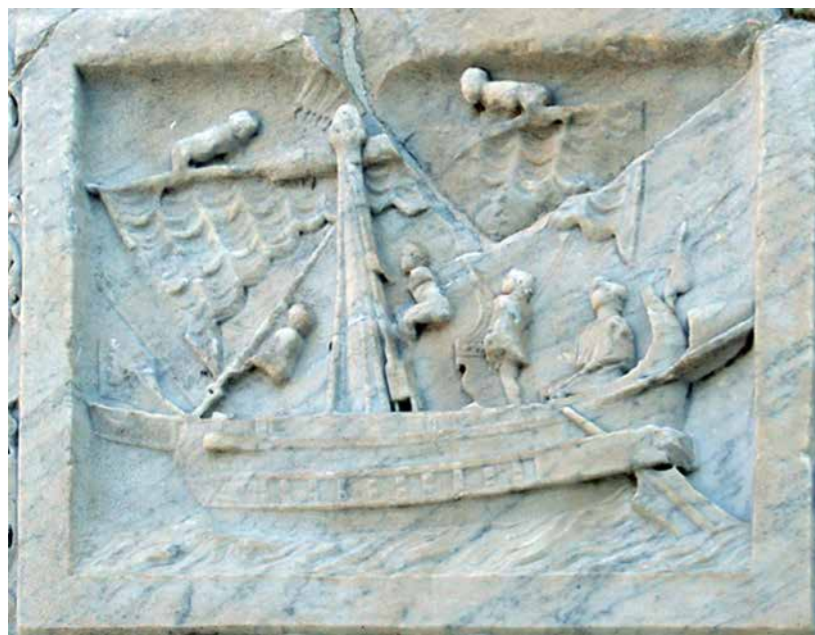
Bateau de transport faisant le commerce de marchandises dont les épices et les substances aromatiques, Pompéï