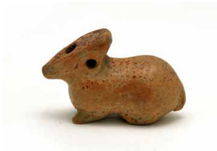
Vase plastique zoomorphe, 800-700 av J.C. Corinthe Céramique, peinture Collection Musée International de la Parfumerie, Photo C. Barbiero

Le choix des parfums à reconstituer a été fondé sur deux principaux critères : leur célébrité et la disponibilité d'une recette. Les recherches sur les textes anciens ont mis en évidence la place de certains parfums dans l'Antiquité. L'huile à la rose ou rhodinon, par exemple, est emblématique de cette période et méritent donc une attention toute particulière. Mais il fallait également que les formules trouvées soient suffisamment complètes pour pouvoir être reconstituées.