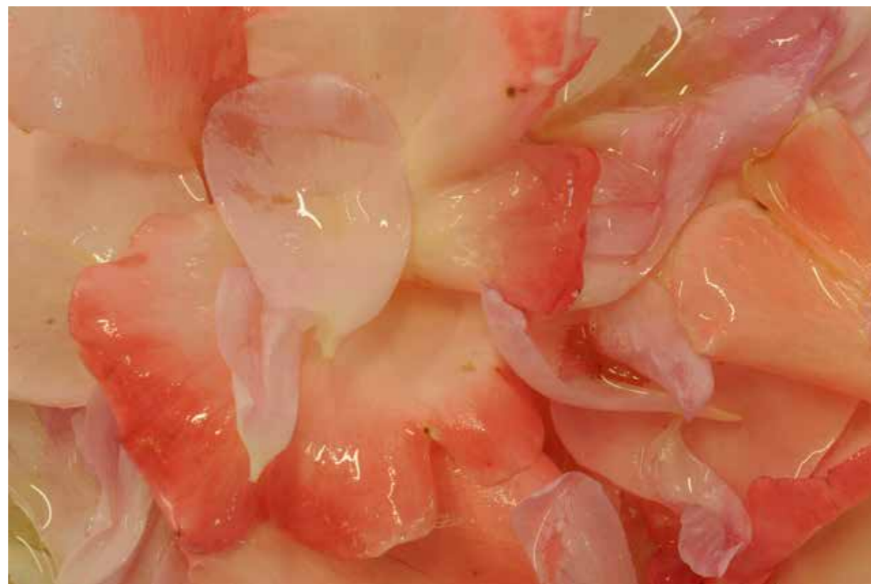
Macération de roses à froid

Collection Musée International de la Parfumerie, Photo C. Barbiero