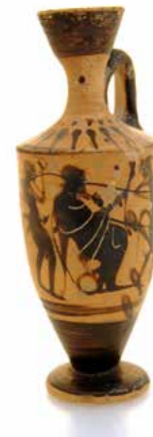
Lécythe, 500-400 av. J.C., Attique Terre cuite Collection Musée International de la Parfumerie