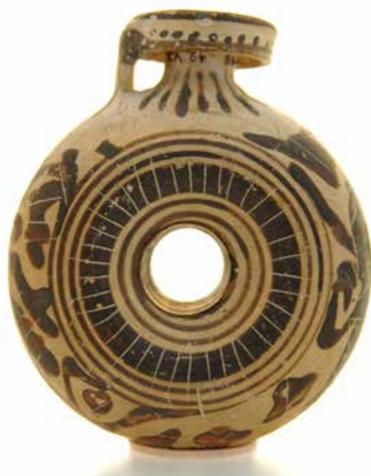
Aryballe annulaire, 700-500 av. J.C., Rhodes

Les huiles parfumées remplirent progressivement des fonctions bien plus étendues, dépassant la sphère religieuse pour couvrir l'essentiel des besoins du corps. Les usages profanes, surtout ceux liés à la séduction, étaient probablement bien plus importants que les sources ne le laissent entrevoir.