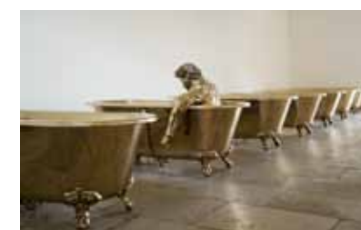
©Jan Fabre, Galerie Guy Pieters