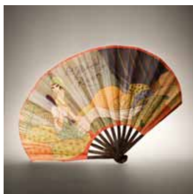
Eventail publicitaire pour Aladin LES PARFUMS DE ROSINE Design. Georges Lepape Vers 1920, Paris Papier, bois, tissu GS Collection