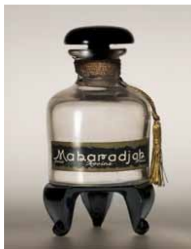
Maharadjah LES PARFUMS DE ROSINE 1921, Paris Verre, bakélite, carton, papier, textile - GS Collection

En référence au Jardin d'Eden, le flacon se transforme en pomme, fruit du péché. La boîte, quant à elle, se pare d'un motif de feuillage réalisé par Raoul Dufy, artiste très proche de Paul Poiret.