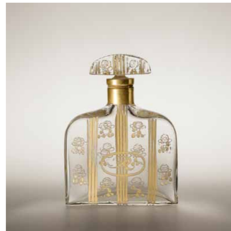
La Rose de Rosine LES PARFUMS DE ROSINE Design. Paul Poiret et Paul Iribé 1912, Paris Verre, carton, papier GS Collection

Dessinée par Paul Iribé, La Rose de Rosine incarne l'emblème de Paul Poiret : la même rose figure en effet sur la griffe de ses vêtements