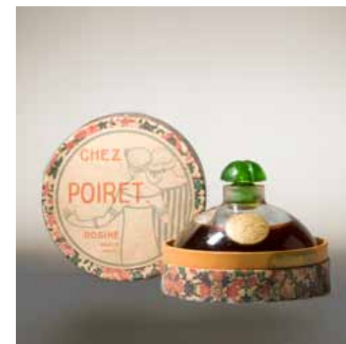
Chez Poiret LES PARFUMS DE ROSINE Design. Paul Poiret et Georges Lepape 1912, Paris Verre, carton, papier - GS Collection

Nom d'une robe de la collection printemps 1912, Chez Poiret se pare d'un flacon rappelant les luxueux poufs ou coussins répartis dans les salons de couture de Paul Poiret. Le conditionnement s'inspire d'une boîte à chapeau agrémentée d'une étiquette reprise de l'album « Les Choses » de Paul Poiret vues par Georges Lepape