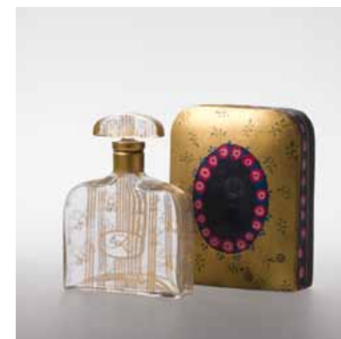
La Rose de Rosine LES PARFUMS DE ROSINE Design. Paul Poiret et Paul Iribe 1912, Paris Verre, carton, papier

Dessinée par Paul Iribe, La Rose de Rosine incarne l'emblème de Paul Poiret : la même rose figure en effet sur la griffe de ses vêtements. Sur la boîte-écriin, Paul Poiret utilise pour la première fois le rébus en guise de nom du parfum. Par ailleurs, le flacon s'inspire de la forme de la robe portée par l'Infante dans Les Ménines de Velasquez (1656).