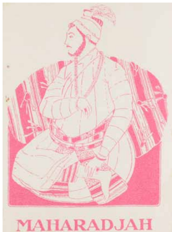
Carte parfumée pour le parfum Maharadjah LES PARFUMS DE ROSINE 1914-1928, Paris