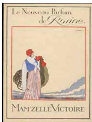
Mam'zelle Victoire, projet pour affiche LES PARFUMS DE ROSINE Design. Paul Poiret et Georges Lepape 1915, Paris Papier Collection MIP

G eorges Lepape, (1887-1971) est un dessinateur de mode, affichiste, graveur et illustrateur français, particulièrement représentatif des années 30. En 1910, il expose au Salon d'Automne où il rencontre Paul Poiret avec qui il se lie d'amitié. Il illustre pour lui en 1911 « Les Choses » de Paul Poiret, considéré comme son chef d'œuvre.