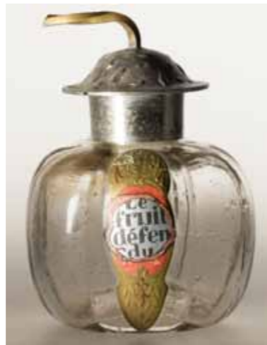
Le Fruit défendu LES PARFUMS DE ROSINE Design. Paul Poiret et Raoul Dufy 1915, Paris Verre, métal, carton, papier GS Collection

Les parfums lancés à cette période retrouvent l'esprit original de Paul Poiret soulignant l'exotisme, l'orientalisme et son goût pour le théâtre.