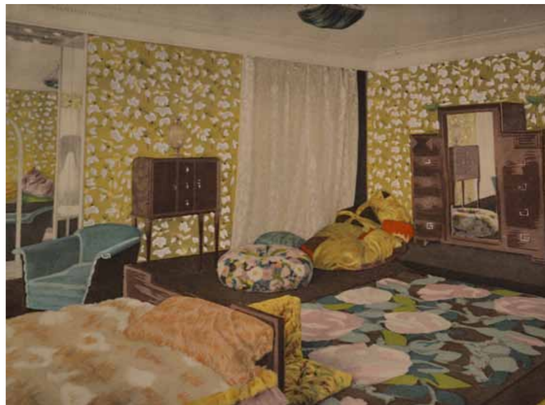
Intérieur Ateliers Martine 1er quart 20e s., Paris Papier GS Collection

Dessinée par Paul Iribé, La Rose de Rosine incarne l'emblème de Paul Poiret : la même rose figure en effet sur la griffe de ses vêtements