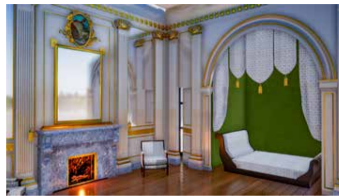
Recreación en 3D de la mansión Clapier-Cabris en 1774