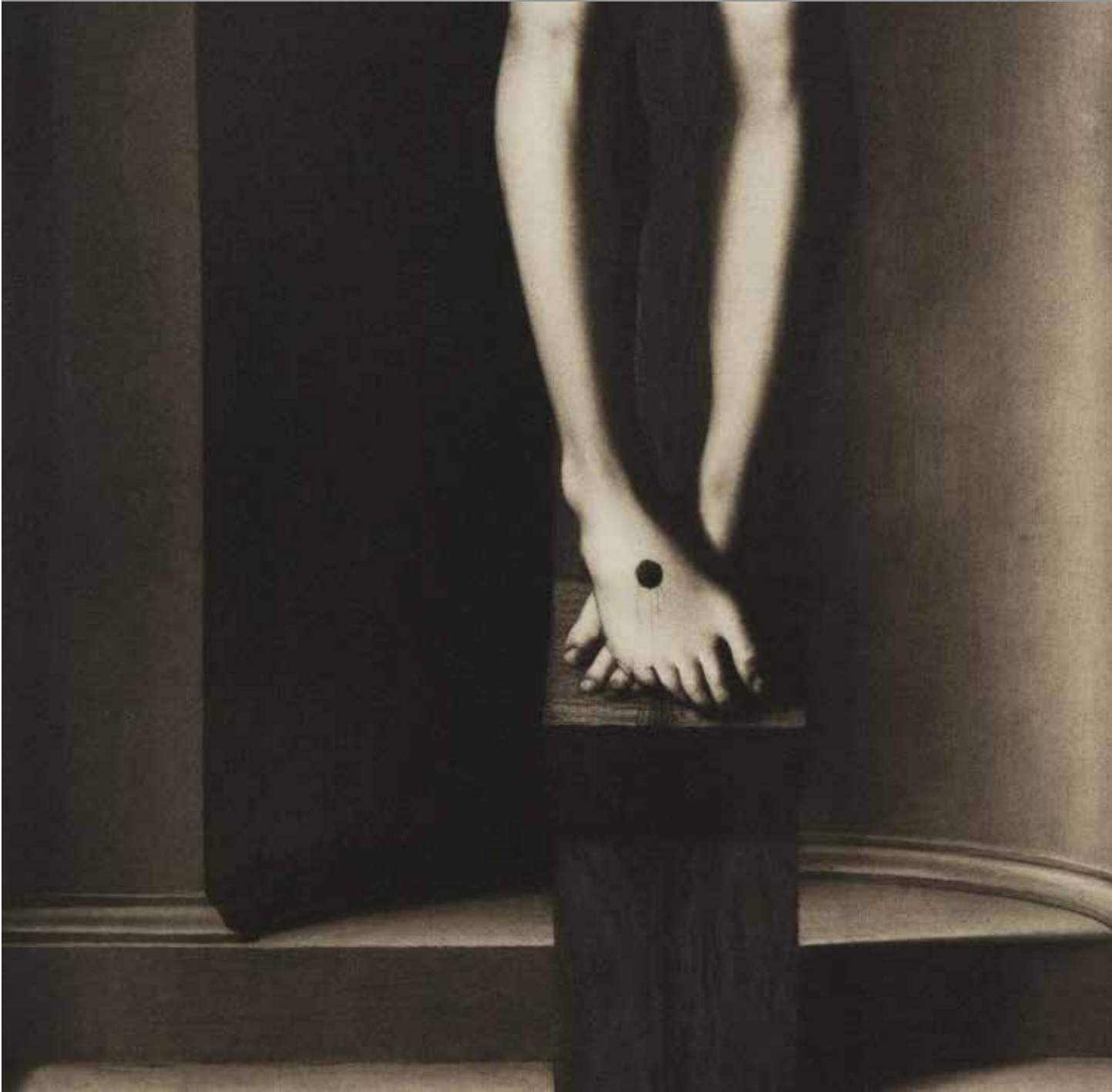
Nice - Musée des Beaux-Arts Jules Chéret Tirage Palladium 2017