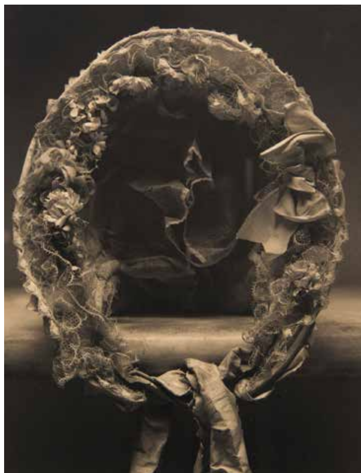
Coiffe - Grasse - MAHP Tirage palladium 2008

L'exposition présente 30 photographies dont certaines réalisées à partir des œuvres du Musée d'Art et d'Histoire de Provence.