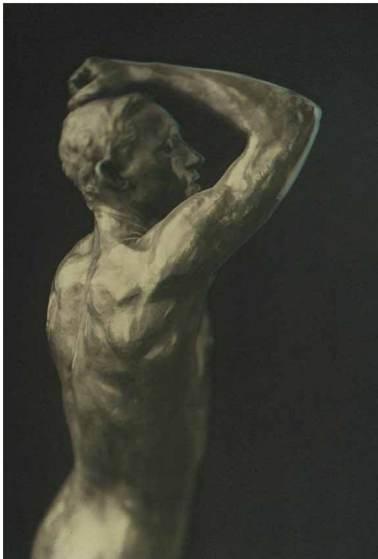
Nice - Musée des Beaux-Arts Jules Chéret Tirage Gomme bichromatée Palladium 2016