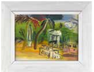
Le jardin à Hyères Raoul Dufy (1877 Le Havre - 1953 Forcalquier) 1943, Hyères, Olio su legno Deposito del Centre Pompidou, Museo Nazionale d'Arte Moderna, inv. D 1965.1.1

Il Museo d'Arte e Storia della Provenza organizza un'esposizione temporanea che offre un'immersione nel cuore della Provenza orientale, dal 18° al 20° secolo. Le opere esposte, che testimoniano la ricchezza e la diversità delle collezioni conservate presso il MAHP, permettono di affrontare numerosi aspetti della vita a Grasse come altrettante sfaccettature che compongono la sua identità.