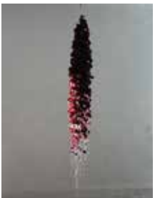
Isa Barbier Chevelure de Bérénice (Capigliatura di Berenice), 2006 petali di rose rosse, fili da cucito in nylon, cera

Il Museo Internazionale della Profumeria di Grasse propone, fino a marzo 2023, una mostra collettiva dedicata ai legami tra il profumo e l'arte moderna. Questi sguardi incrociati di artisti costituiscono una testimonianza attuale sul mondo degli odori oggi a Grasse, culla storica dei know-how della profumeria.