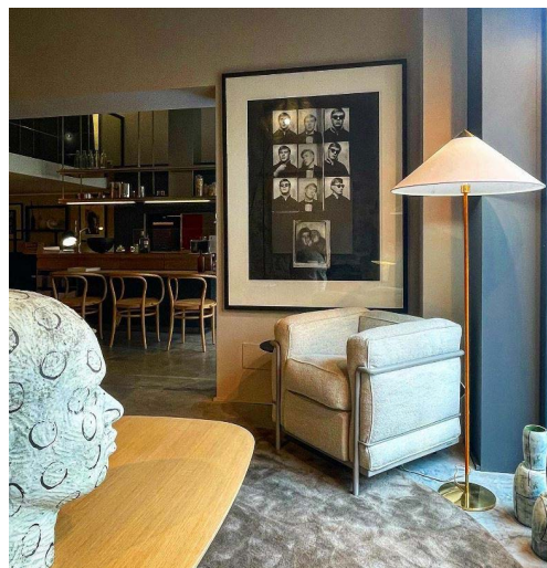
Photographie de Gerard Malanga chez Bel Oeil Cannes