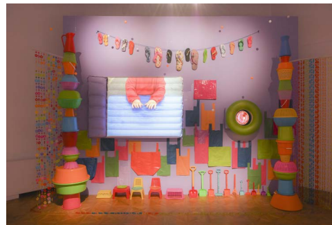
Agnès VARDA, Ping-pong, tong et camping, 2006