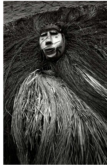
Vodou Zangbeto, 1989, Séko, Togo