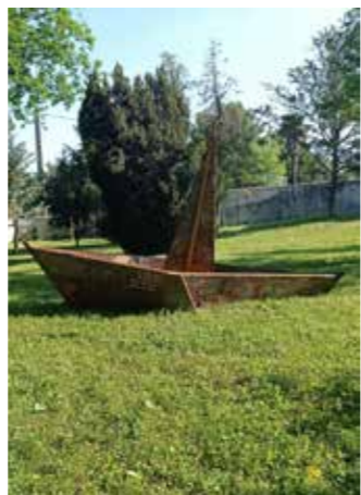
Esquif à palabres (Barca a chiacchiere), di Bernard Briançon