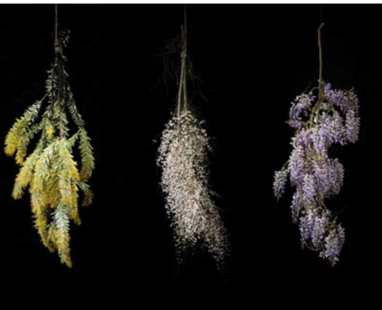
Febbraio Mimosa - Marzo Ginestra bianca - Aprile Glicina Célia Pernot Fotografia

Se le opere finali sono fotografiche, la loro realizzazione ha a che vedere con la scultura, la messa in scena di persone e oggetti, la modellazione di una luce che rivisita la storia dell'arte, nonché con l'interpretazione della paletta dei colori naturali delle stagioni. L'incrocio di pratiche artistiche e scientifiche permetterà di condurre una riflessione sulla rappresentazione di un patrimonio comune, la flora e i paesaggi emblematici del Pays de Grasse, per sensibilizzare sul suo valore attraverso uno sguardo contemporaneo.