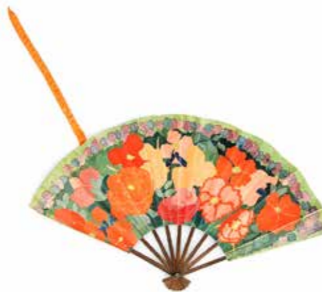
Ventaglio pubblicitario Paul Poiret, Les parfums de Rosine Verso 1920 Carta, legno, metallo Museo Internazionale della Profumeria, inv. Z 1041

Il Museo Internazionale della Profumeria organizza durante l'estate 2023 una mostra dedicata al processo di creazione delle marche messo in atto dalle maison produttrici di profumi. All'inizio del XX secolo, elaborare l'immagine di un profumo spetta agli illustratori più prestigiosi che espongono in strada le loro creazioni coloratissime. Jules Chéret, Alphons Mucha e poi Leonetto Cappiello mettono quindi i loro talenti al servizio dei profumieri più famosi. Dopodiché, con l'evoluzione delle tecniche di stampa e di quelle audiovisive, le immagini fotografiche e cinematografiche diventano la norma finché i social network si impadroniscono di tali codici facendoli quindi evolvere. La mostra presenta l'evoluzione dei codici visivi delle campagne pubblicitarie delle maison produttrici di profumo durante più di un secolo, dalle illustrazioni di Jules Chéret e Leonetto Cappiello alle fotografie di Helmut Newton e Jean-Paul Goude senza dimenticare gli spot pubblicitari realizzati dai più grandi registi come Martin Scorsese o Darrenn Aronofsky. La mostra è l'occasione per il Museo Internazionale della Profumeria di presentare al pubblico la sua ricca collezione di pubblicità, flaconi, biglietti profumati, pietre litografiche nel loro contesto storico e stilistico. Queste collezioni saranno arricchite da prestiti pubblici e privati di prestigiose istituzioni al fine di completare questo approccio sociologico e artistico.