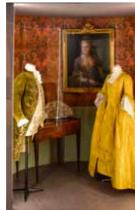
Vestito e Gilet, Abito alla francese, ventaglio e toeletta del XVIII secolo Ritratto di donna di Claude Arnulphy Museo d'Arte e Storia della Provenza

Il Museo d'Arte e Storia della Provenza organizza un'esposizione temporanea che offre un'immersione nel cuore della Provenza orientale, dal XVIII al XX secolo. Le opere esposte, che testimoniano la ricchezza e la diversità delle collezioni conservate presso il MAHP, permettono di affrontare numerosi aspetti della vita a Grasse come altrettante sfaccettature che compongono la sua identità. Questa esposizione si propone di fare scoprire le sue feste e tradizioni popolari, la sua vita artistica, nonché la storia della costruzione del museo attraverso collezioni di fotografie, strumenti di musica, ceramiche, tessuti o di belle arti.