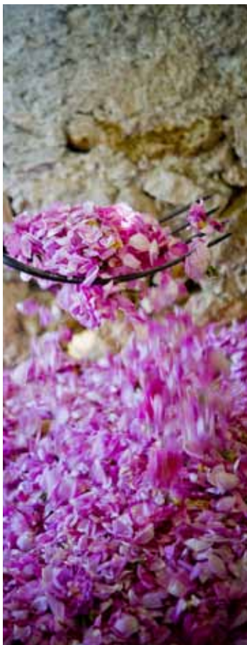
LA CONNAISSANCE DES MATIÈRES PREMIÈRES NATURELLES ET LEUR TRANSFORMATION