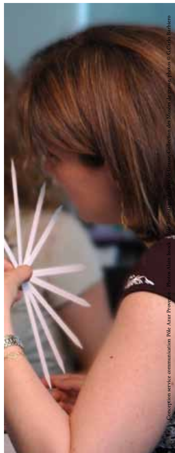
L'ART DE COMPOSER LE PARFUM