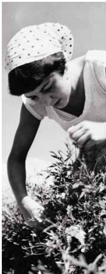
LA CULTURE DE LA PLANTE À PARFUM